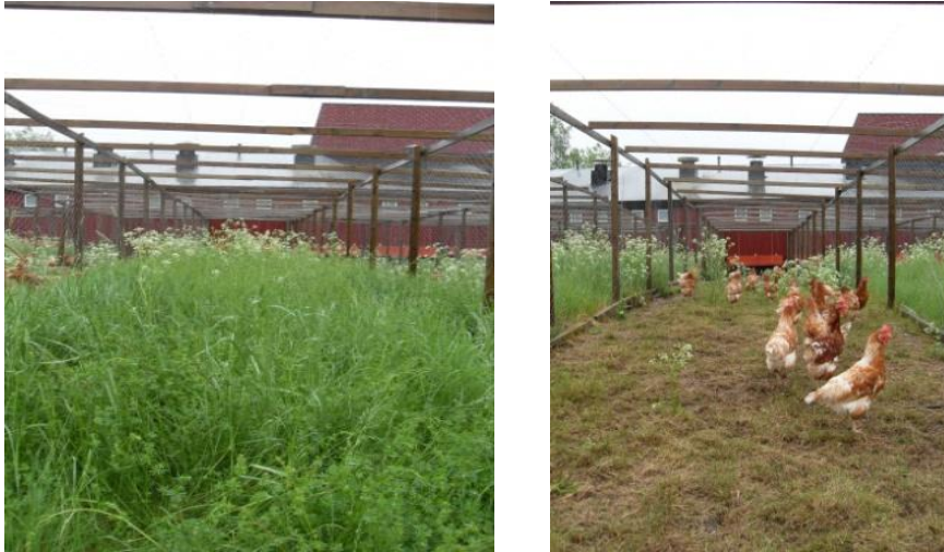
Figur 1. Rastfålla för LSL (vänster) och LB (höger).

Flera skillnader mellan djurmateriälerna i produktion och äggkvalitet framkom (tabell 3). I jämförelse med LB hönorna hade LSL högre värpprocent. LB hönorna lade dock tyngre ägg och därmed sågs ingen skillnad mellan hybriderna i kg ägg producerat per insatt höna under hela produktionscykeln. För LSL hönorna åtgick 1,96 foder för att producera ett kg ägg medan LB förbrukade 2,07 kg foder per kg producerat ägg ( P < 0,01 ). Genotypskillnader av detta slag kan delvis bero på skillnader i levande vikt och i studien vägde LB hönorna mer än LSL. Ägg från LSL hönor hade signifikant högre höjd på äggvitan och även en högre s.k. Haugh unit än LB. En mycket hög andel fellagda ägg (ägg ej lagda i redet) hos LB hönorna resulterade i signifikant högre andel smutsiga ägg hos LB jämfört med LSL.