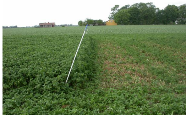
Putsningsdemonstration i rödklöver