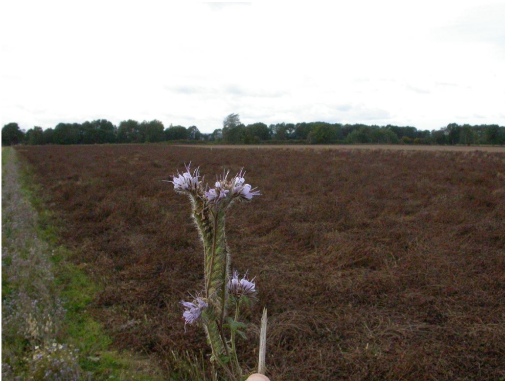
Ett stråk med honungsört intill ett fält med rödklöverfrö.

Honungsört, som också kallas honungsfacelia, är en ettårig växt med blå eller lila blommor som blir ca 70 cm hög. Den har god marktäckande och ogräskvävande förmåga. Den är inte kvävefixerande och har en god förmåga att ta up växtnäring. Den har inga kända växtföljdssjukdomar. Honungsört blommar ca 8 veckor efter sådd.