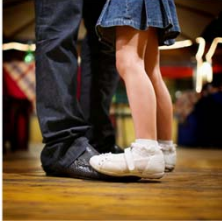
Jackis Lannek Jordbruksverket