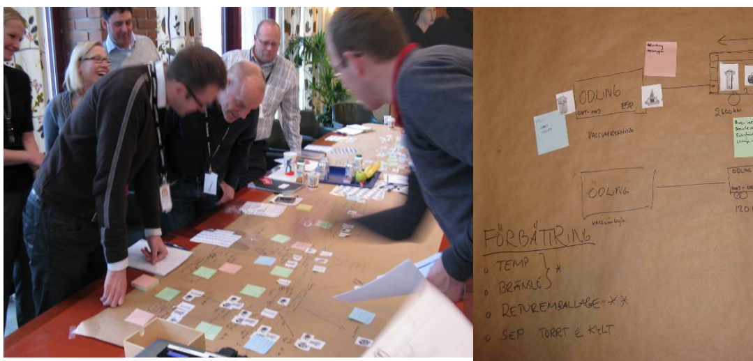
Figur 1. Workshop 1 praktisk samverkan mellan aktörerna med livsmedelskedjan i fokus.

Syfte: Att ge en grundläggande bakgrundskunskap kring kedjan och de deltagande företagens verksamhet samt att skapa samsyn. Att diskutera centrala frågor om slöserier, svinn, kvalitetsaspekter utifrån ett kedjeperspektiv, samt identifiera vilken information som finns och var det finns kunskapsluckor.