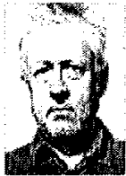
Av Leif GW Persson gw@expressen.se

Varför skaffade ni er inte en dvärghamster i stället?