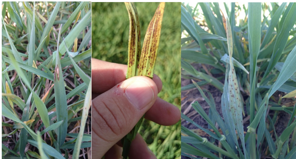
Olika typer av fysiologiska fläckar i höstkorn