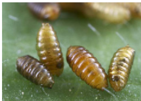
Puparier där flugpupporna är redo att kläckas.

Puppan ligger skyddad inuti sista larvstadiets stelade larvhud, som strikt vetenskapligt benämns ett puparium. En del puparier kan bli hängande under bladet, men de flesta hamnar på marken. Chromatomyia -arter däremot förpuppas alltid i bladet, inuti minan. När nyaflugor kläckts parar de sig och honorna börjar lägga ägg. En hona lägger över 200 ägg under sin livstid (ca två veckor).