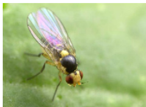
Liriomyza bryoniae .

Av släktet Chromatomyia ser man ibland krysanthemumflugan, C. syngenesiae , på krysanthemum och margueriter. Sallat är också värdväxt. Den mer polyfaga C. horticola kan angripa t.ex. gurka, men det blir sällan mer än enstaka minor i bladen. Chromatomyia -arterna är gråsvarta med mörk behåring.