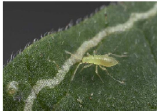
Nymf av Macrolophus caliginosus på tomatblad med mina.

Macrolophus är långsmala, ljusgröna insekter med mörka ögon och antennbaser. De vuxna blir 5-6 mm långa men storleken till trots kan de vara svåra att upptäcka då de är mycket rörliga.