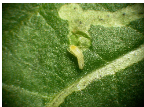
Öppnad mina med halvstor larv.

Fullstora larver av Liriomyza -arter lämnar bladet och förpuppas på marken eller liggande kvar på bladverket.