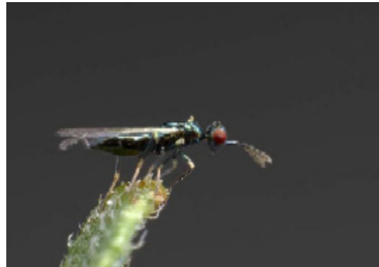
Diglyphus isaea .

Det är därmed en mycket effektiv art vars enda nackdel är trögheten vid etablering. Den har inte så god sökförmåga när angreppet är litet, och det är ofta svårt att få igång populationen på våren. Men man bör inte dröja med utsättningarna av Diglyphus , även om det blivit bra fart på Dacnusa i ett tidigt skede. Ju snabbare man får igång Diglyphus desto säkrare är man att lyckas med bekämpningen. Även Diglyphus hör till vår inhemska fauna, men till skillnad från Dacnusa och Opius kan arten inte övervintra i tomma växthus. Den går i dvala som vuxen insekt och sitter då gömd i skyddande vegetation, t ex barrträd eller torkat gräs.