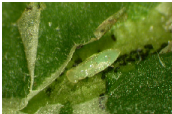
Öppnad mina med puppa av Diglyphus isaea .

Diglyphus honan borrar hål på fluglarvernas hud och äter av den kroppsvätska som sipprar ut genom bladet. På detta sätt tar varje hona död på många hundra fluglarver. Parasitering (äggläggning) brukar uppgå till drygt 300 per hona.