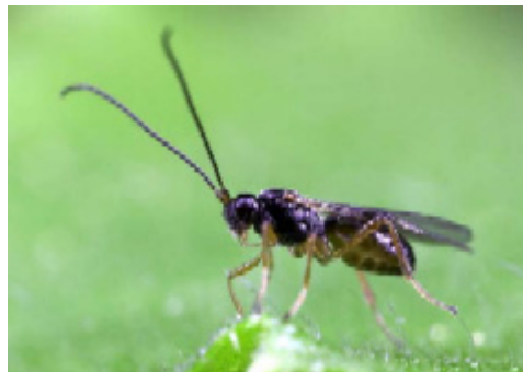
Dacnusa sibirica .

Parasitstekeln Dacnusa sibirica är ett bra vapen mot minerarflugor tidigt på säsongen. Steklarna är duktiga på att finna enstaka minor, och man ser ofta en hög parasiteringsgrad (uppåt 80-90 %) så länge plantorna är små. Stekelhonan letar upp fluglarven i bladet och sticker in sitt ägglägningsrör genom blad och larvskinn. Ägget placeras i fluglarvens kropp, där utvecklingen äger rum.