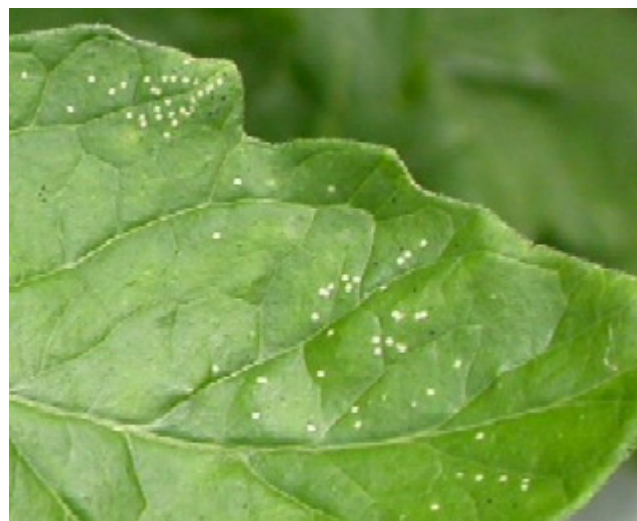
Tidiga symptom av Liriomyza bryoniae , stick i tomatblad.

Under sommaren kan inflygning ske från växthusens närmaste omgivning.