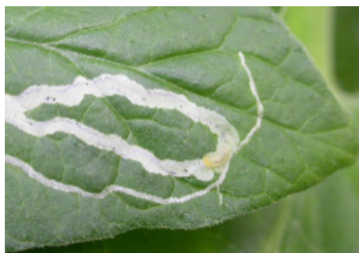
Mina med larv, färdig att krypa ut.

När äggen kläckts äter larverna sig fram i slingrande gångar, så kallade minor, inuti bladet.