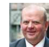
Eskil Erlandsson landsbygdsminister