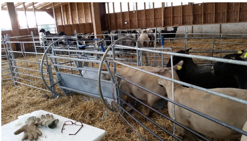
Figur 1. Tackor väntar på klövkontroll i tackvändaren

Vid anslutning till Klövkontrollen undersöker en veterinär, som är specialutbildad i klinisk fotrötediagnostik, alla klövar på samtliga livdjur i besättningen och provtagning avseende D. nodosus inklusive virulensstestning utförs. Under genomgången tar djurägaren aktiv del av klövinspektionen för att få kunskap om hur friska klövar ska se ut och vilka avvikelser som kan förekomma. Detta är en förutsättning för att djurägaren sedan ska kunna utföra klövkontrollerna nästkommande år i sin egen besättning.