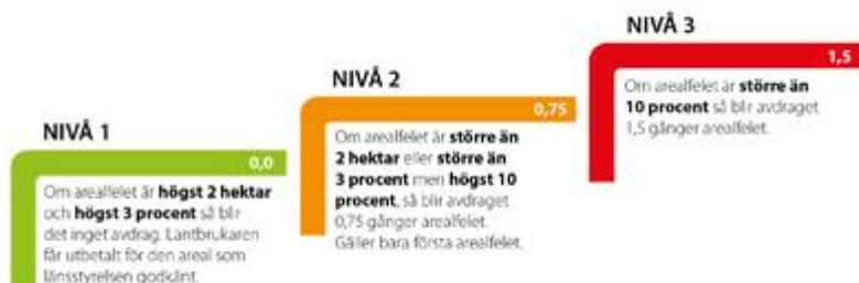
Illustration som visar de olika avdragsnivåerna.

Hur stort avdraget blir beror på hur stort arealfelet i din SAM-ansökan är. Det finns tre olika nivåer.