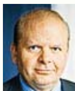
Eskil Erlandsson Jordbruksminister

Jordbruksdepartementet ansvarar bland annat för frågor som gäller jordbruk, fiske, rennärning, samefrågor, djurskydd, livsmedel samt jakt och viltvård.